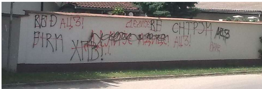
Слика 1: Једини зид погодан за навијачко легитимисање на улазу у новосадско насеље Адице.

Адице се налазе у небрањеном појасу заштите од поплава, одмах иза насипа који ограничава насеље Телеп. 30 Да је становништво досељено из крајева са већом надморском висином показује и то што већина кућа, иако се налазе у појасу с високим подземним водама, има изграђене подруме, који се овде не дозвољавају, према урбанистичким прописима. Најважнија саобраћајница је улица Бранка Ћопића (једна од неколико асфалтираних, од укупно 200), преко које води једини и веома узак улаз у Адице, с тек два-три зида у приватном поседу, на којима би могло да се изрази оглашавање територије графитима. Сасвим извесно, Делије контролишу овај читав крај, али морају бити стално на опрезу због Фирмаша који се не мире с доминацијом Делија на Телепу, насељу у које се, на овој тачки, улази од стране Адица, гледано према центру. Стање забележено 19. маја 2013. дато је на Слици 1 . Након тог датума, зид је, у више наврата, окречен, а од 13. јануара 2014. до данас, доминира недирнут натпис „Делије Адице“, што би требало да имплицира коначну победу једне стране.