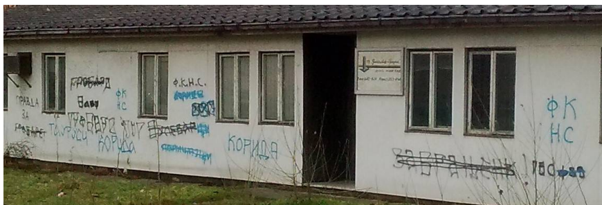
Слика 2: Окршај спрејевима између Гробара и Корида у улици Јаше Томића

Други пример је Булевар Јаше Томића (види Слику 2 и Карту 1 ), који дели северну границу територије Фирме, под контролом подгрупа Пандора и ПК, од простора у коме су измешани Гробари и Корида. Отуда зидови насеља Банатић декодирају локалидентитетска превирања супростављених страна, потпуније од већ цитираних декларативних изјава попут: Корида = Гробари.