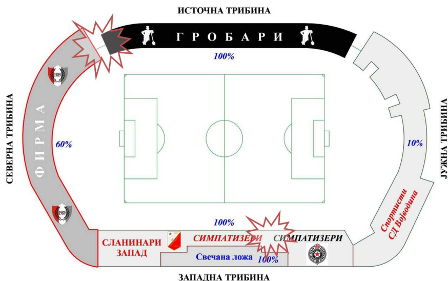
Слика 4: Дистрибуција навијача на стадиону „Карађорђе“ на дербију с Партизаном и тачке инцидената у облику размене увреда, пројектила и физичких насртаја.

Као илустрацију нешто ширег просторног контекста, посебно препоручујем видео снимак помпезног перформанса прославе стогодишњице клуба, приликом које су се Фирмаши расподелили на дунавском кеју, Варадинском мосту и дуж бедема Петроварадинске тврђаве и једновремено упалили стотину рођенданских свећица (бакљи), чиме су најјасније могуће обележили своје место визуре, кретања, окупљања и становања. 34